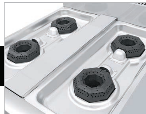
Cubierta semi-sellada para evitar derrames al interior.

Disponibles en tres diferentes versiones: