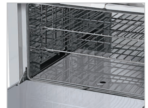
Hornos mucho más productivos. ¡Puede hornear de todo! Pan, pasteles, aves, pescados, carnes, pasta, etc.