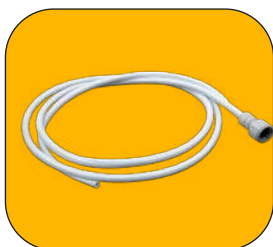
Manguera de alimentación con conector de 1/2"