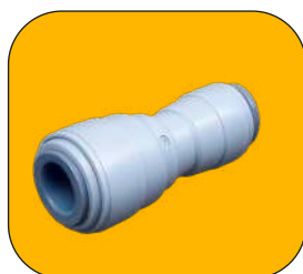
Cople de conexión rápida 1/2" a 1/4"