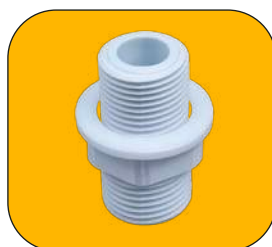
Cople de 1/2"