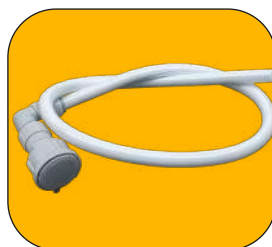
Manguera corta de alimentación con conector de 3/4"