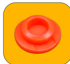
Tapón del desagüe de depósito de hielos