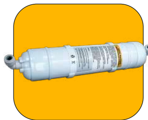
Filtro con codos de unión de 1/2"