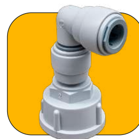
Conector de 3/4"