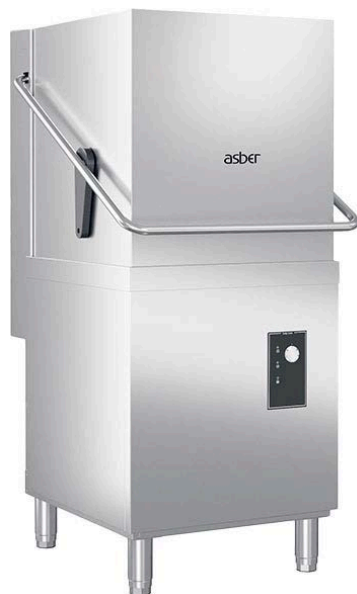
GEX-H510 DD SA

Consultar al fabricante los datos de potencia y de amperaje.